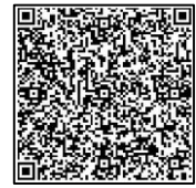
Datum Bangkok, 19.12.201414